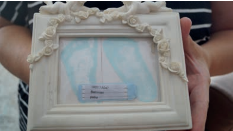
Rasmusen jalanjäljet on kauniisti ikuistettu tauluun. Konkreettiset muistot ovat tärkeitä.