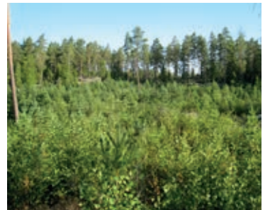
Seurakunta on istuttanut uusia taimikoita esimerkiksi Haukkavuorella.

- Tämä on sastamalaisille hyvä päätös. Se on kaikkien kaupungin asukkaiden käytettävissä virkistysalueena, Kemppi arvioi Papinsaarta.