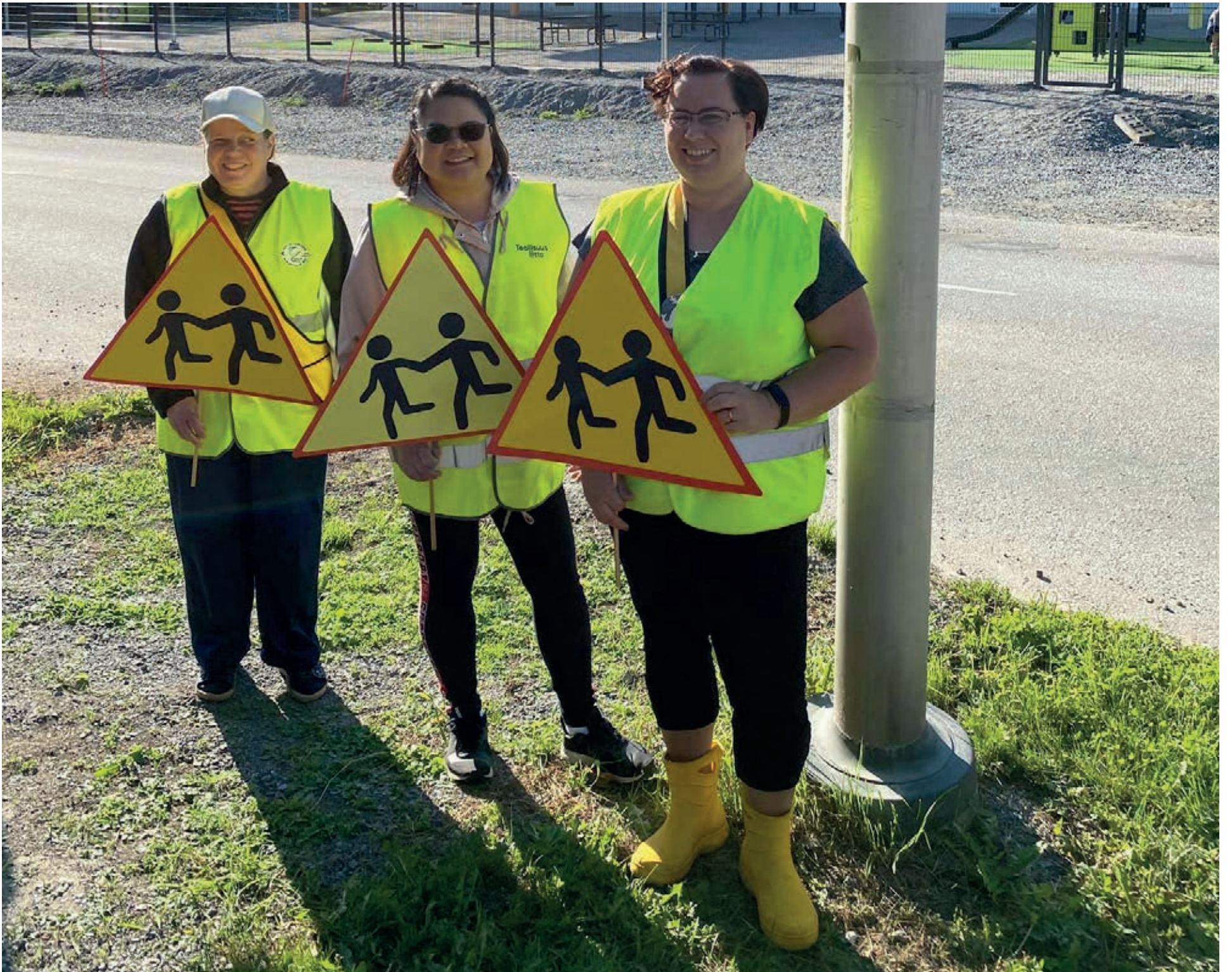
Sastamalan seurakunnan lastenohjaajat suojatien-engeleinä Vareliuksen koululla.