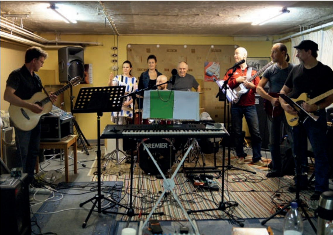
Rokkikirkon harjoitukset käynnissä Vammalan vanhan kaupungintalon alakerran treenikämpillä.