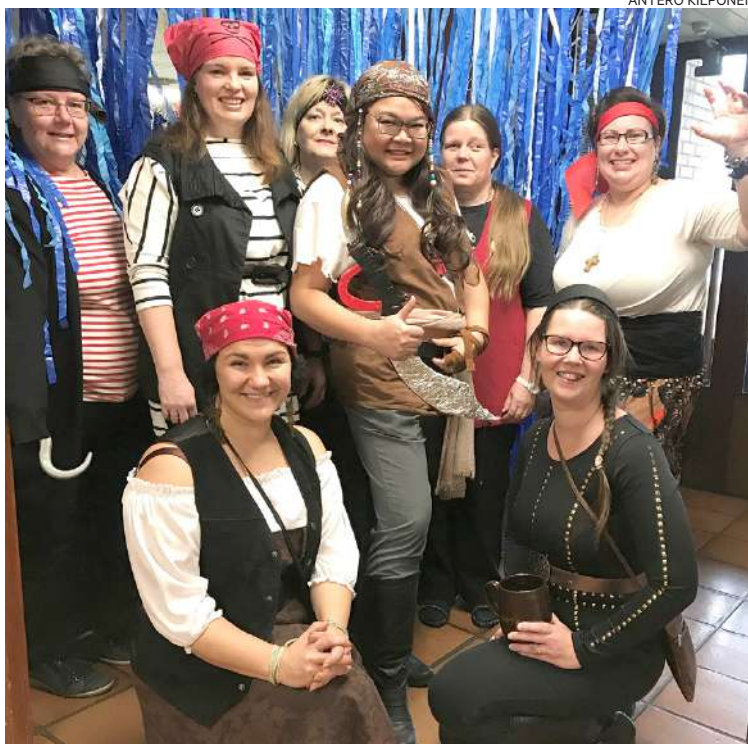
Kasvatuksen tiimi odottaa lapsia ja perheitä mukaan toimintaan. Tiimiläisiä kuvattuna 27.10.2019 järjestetystä koko perheen Merirosvoiseikkailu -tapahtumasta.

Kaiken kaikkiaan kerhotoimintaa järjestetään 12:ssa eri paikassa ympäri Sastamalaa. Seurakunnan per-