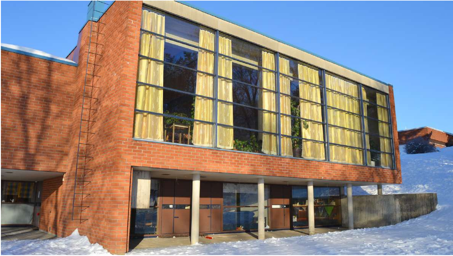
Kiikan seurakuntatalon salia hallitsevat suuret, Kokemäenjoelle avautuvat ikkunat. Karun kauniit betoniseinät ja tiililattia antavat sisätiloille omaleimaisen ilmeen.