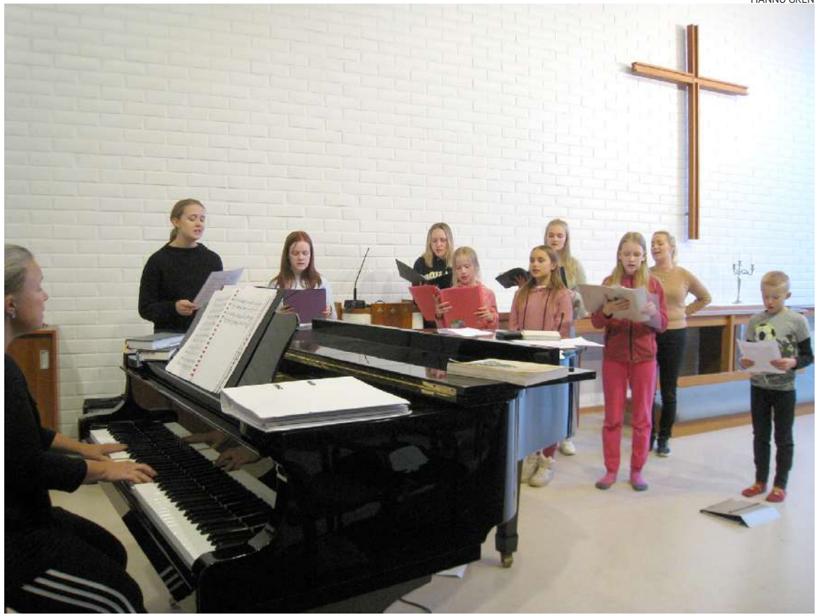
Kuorolaiset ovat treenanneet joulukuun musikaalia varten sekä Vammalassa että Mouhijärvellä.