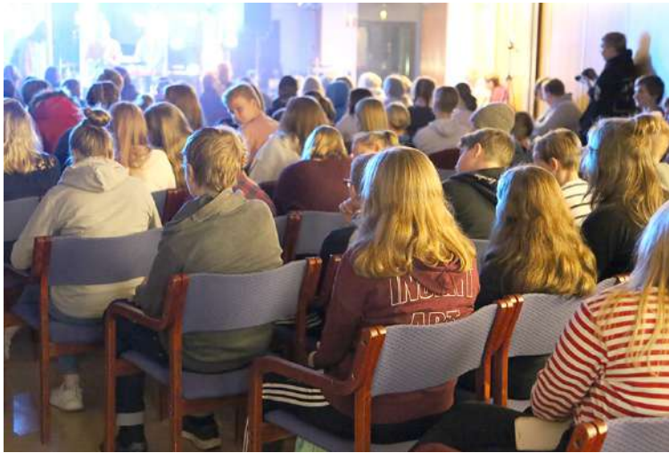
Seurakunnan nuorten toiminnassa musiikki on paljon puhetta tärkeämpi elementti. Sastamalan seurakunta järjestää joka syksy Valofest-musiikitapahtuman nuorille.