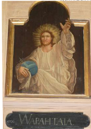
Wapahtaja on yksi kirkkomaalari Carl Fredrik Blomin Kiikan kirkon lehterikaiteisiin tekemästä 36 maalauksesta.