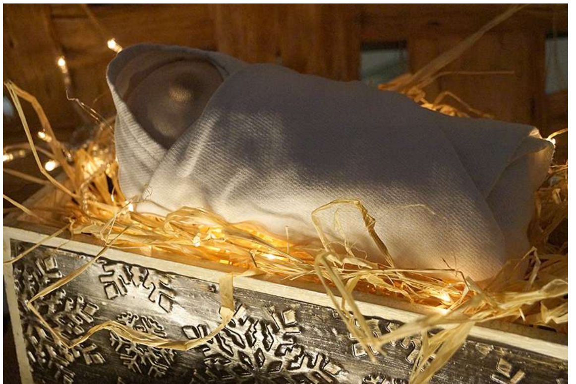
Hoosianna-kirkosta kauneimpien joululaulujen kautta joulukirkkoon ja Enkeli taivaan -virteen kulkee polku jouluun.