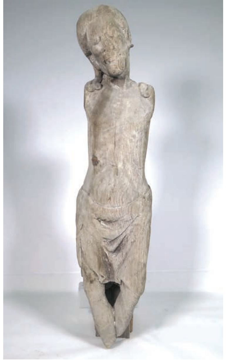
Sastamalan Pyhän Marian kirkossa säilynyt Kristus-veistoksen torso on puhuttelevan kaunis ja ilmeikäs.

Tutkimuksen tulokset julkaistaan myöhemmin. Muutoksen veistäjät-tutkimushankkeesta ja sen kohteista voi lukea lisää hankkeen Facebook-sivuilta osoitteessa https://www.facebook.com/carvingouttransformations/ ja blogista osoitteessa https://blogit.utu.fi/wooden/