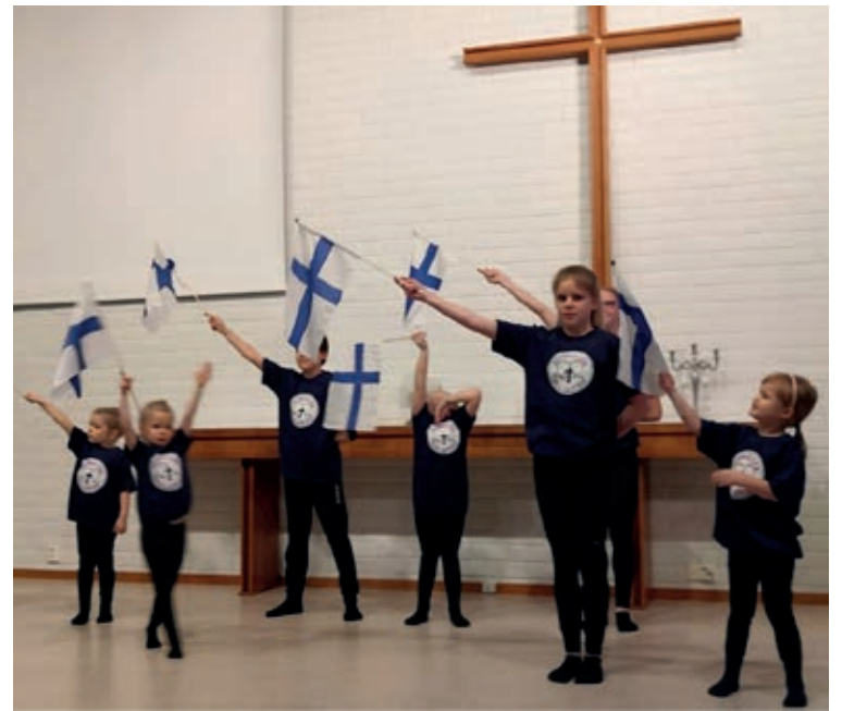
"Nouse salkoon lippu valkoinen. Piirrä pilviin risti sininen. Se on kallein aarre isänmaamme, merkki Kuninkaamme, liitto ikuinen. Nouse salkoon toivo sydänten, nouse salkoon risti Jeesuksen."

Enkelilahjatoivekaavakkeita saa diakoniatoimistoista tai oman alueen diakoniatyöntekijältä. Kaavakkeiden palautus viim. 16.11. diakoniatoimistoihin tai Sastamalan srk/diakonia, Aittalahdenkatu 12, 38200 Sastamala.