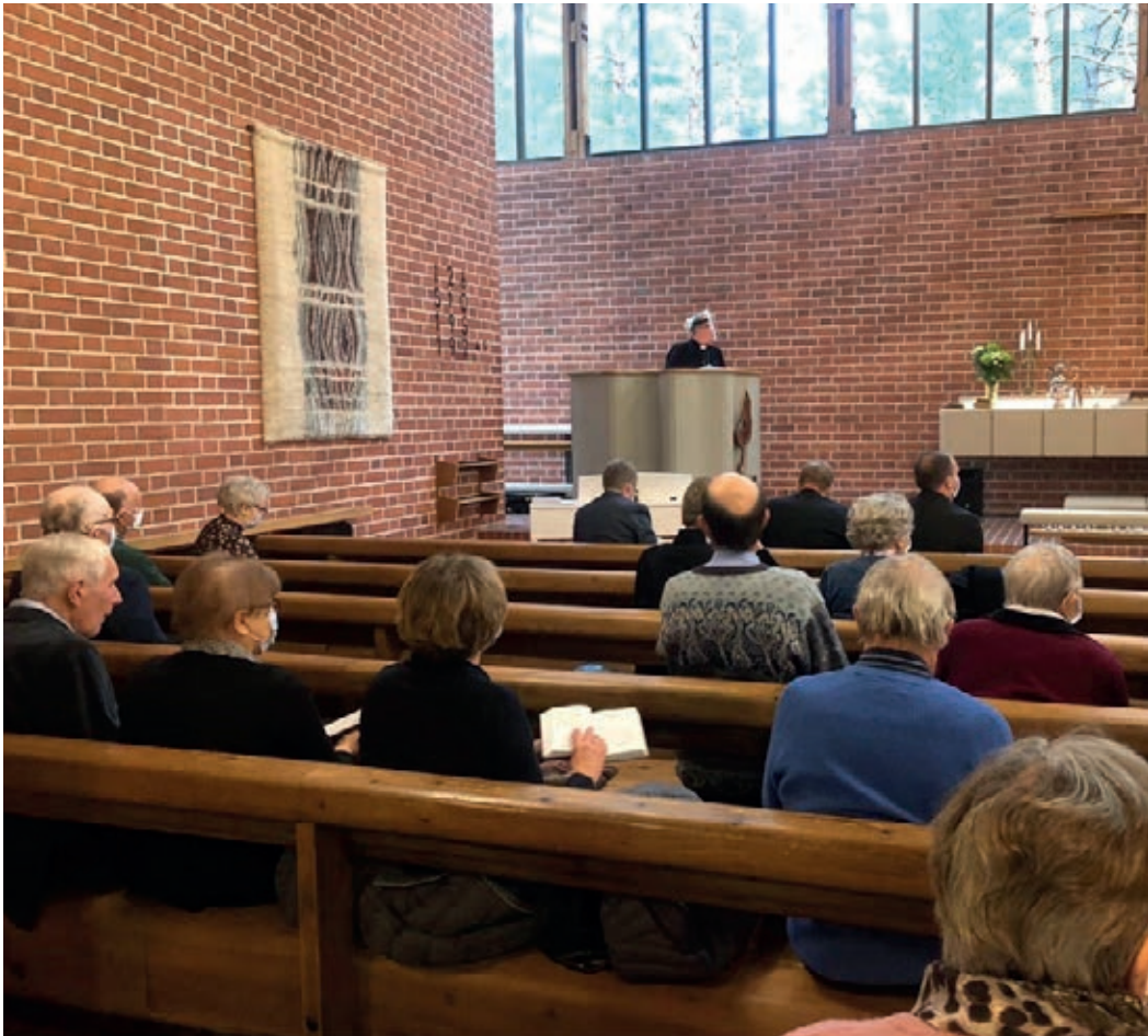
Salokunnan kirkon 60-vuotisjuhlaa vietettiin historiallisesti erikoisena korona-aikana maskien ja visiiri- en kanssa.