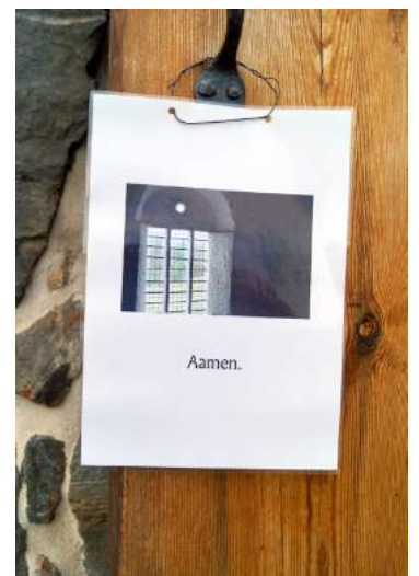
Ihminen pelastuu yksin Kristuksen tähden.

Kaikki tehtävät ovat kutsumusta. Myös se, mitä tehdään olosuhteiden pakosta. Hienointa on tehdä kaikki tinkimättä ja niin hyvin kuin osaa. Arkinen tehtävämme on jumalanpalvelus, jossa palvellaan parhaiten Jumalaa ja toista ihmistä.