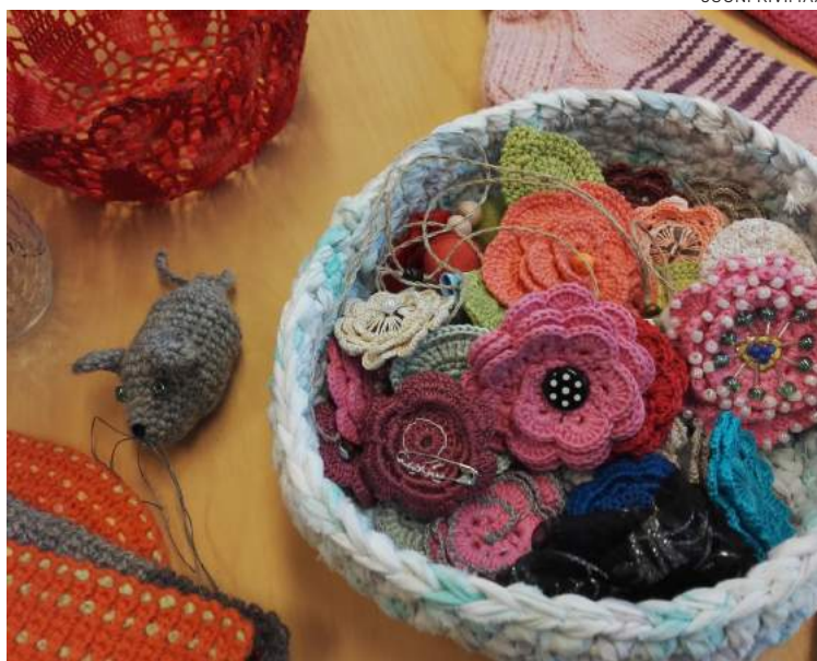
Tärpissä tehdään kädentöitä ja niitä on myös myynnissä.

Tärpistä voi myös ostaa käsitöitä, kortteja ja muuta pientä kivaa! Tuotto menee diakoniatyön kautta Tärpin toiminnan kehittämiseen ja asiakkaiden virkistämiseen. ”Paas poiketen kaffeelle!”