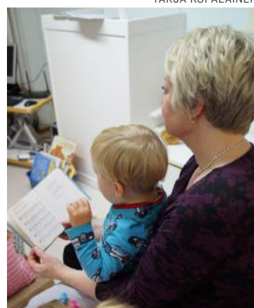
Hartaudet koskettavat kaikenikäisten elämää.

Vaikka nämä em. toimitukset muodostavat keskeisen osan pappien, kanttoreiden ja seurakuntames-