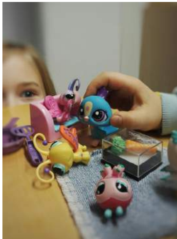
Seurakunnan leirejä löytyy joka lähtöön, lapsille, nuorille ja perheille.

Isosena toimiminen on yksi tapa olla aktiivinen seurakunnan jäsen.