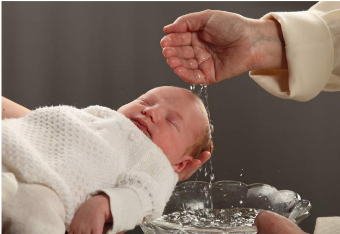
Kaste auttaa nuoren elämän hyvään alkuun.

Kastejuhla on hieno tapa juhlistaa uuden elämän ihmettä ja kokoontua suvun ja ystävien kanssa kiittämään saadusta elämän lahjasta.