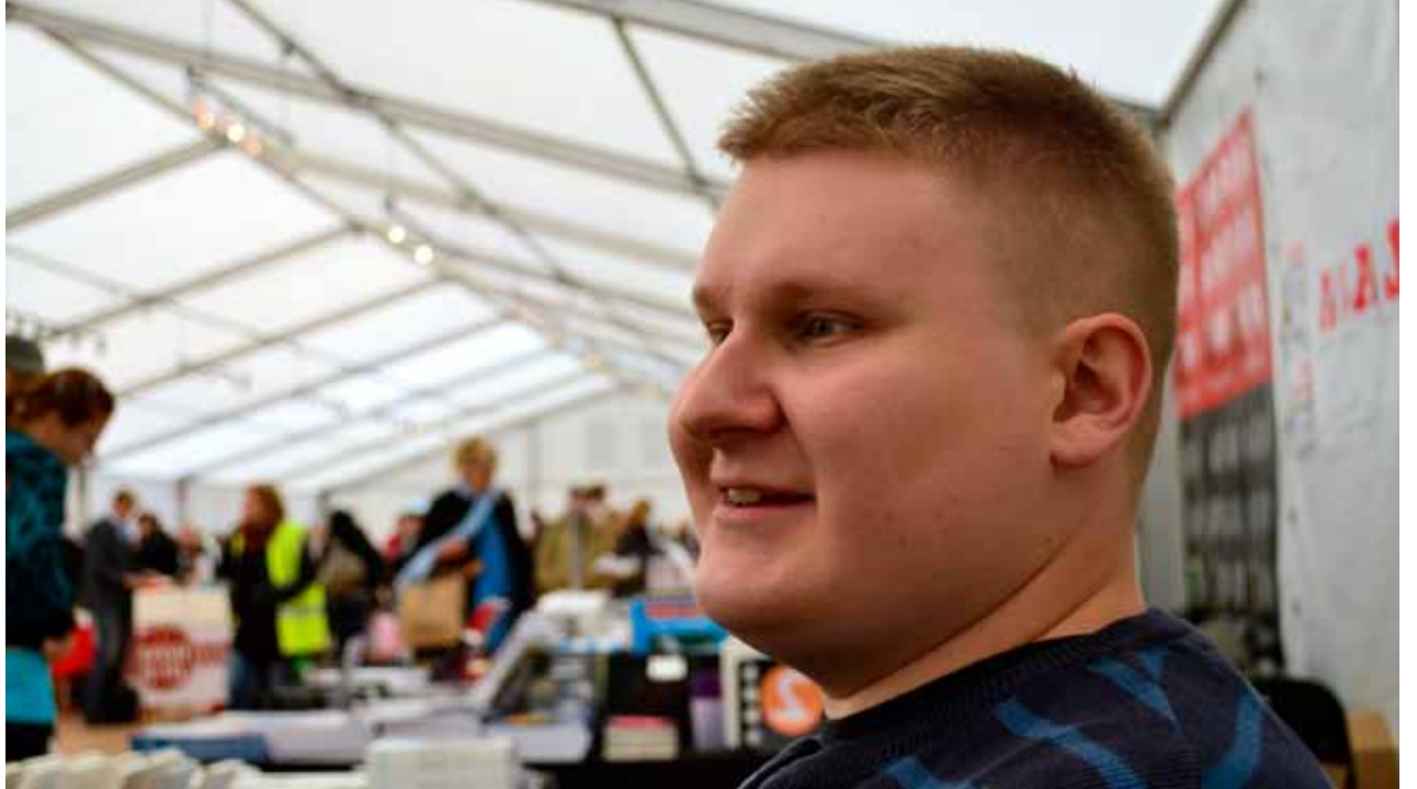
Mikaelin mielestä huumori on erittäin sallittu juttu kristitylle. Senpä takia miehen Sananjalka-sarjis levittää Sanaa vähemmän pönöttävästi.

Työtä tehdään rukoillen ja uskon, että Taivaan Isä siunaa kaikkia arkienkeleinä toimivia.