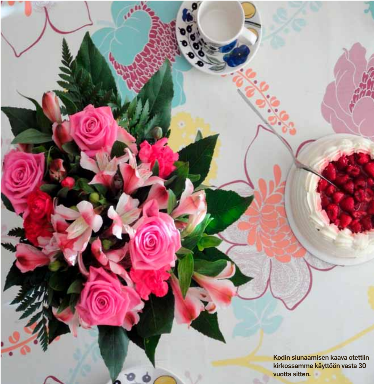
Kodin siunaamisen kaava otettiin kirkossamme käyttöön vasta 30 vuotta sitten.