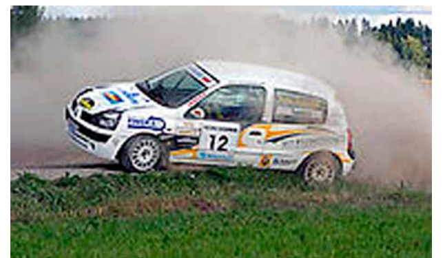
Lahjoita vanha autosi nuorison korjattavaksi. Myös Sastamalan Autourheilijat ovat mukana autopajatoiminnassa.

Nyt liikuntakerho on jokaiselle osallistujalle nimensä mukainen ja ainakin minusta siellä on ollut kivaa! Luultavasti näin on yleensä myös nuorten osallistujiemme mielestä. Kerhossa on silti vielä tilaa. Jokainen uusi kerholainen on ilman muuta tervetullut!