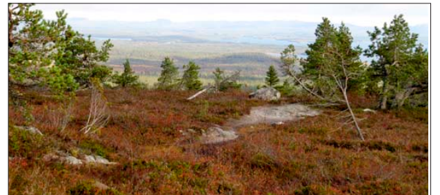
RETKEI Raattamaan järjestetään 19.–26. syyskuuta.

kollisissa tiedoissa kesä- ja heinäkuun aikana. Vs. johtava kanttori Anu Mattila ottaa ilmoittautumisia vastaan ja antaa lisätietoja numerossa 050 314 9021. Ilmoittautuminen ensimmäiseen soutuun 15.6. mennessä ja jälkimmäiseen 13.7. mennessä. Innostus laulaa ja soutaa on aikaisempaa soutu- ja laulukokemusta tai kovaa kuntoa olennaisempi asia, joten rohkeasti mukaan vain!