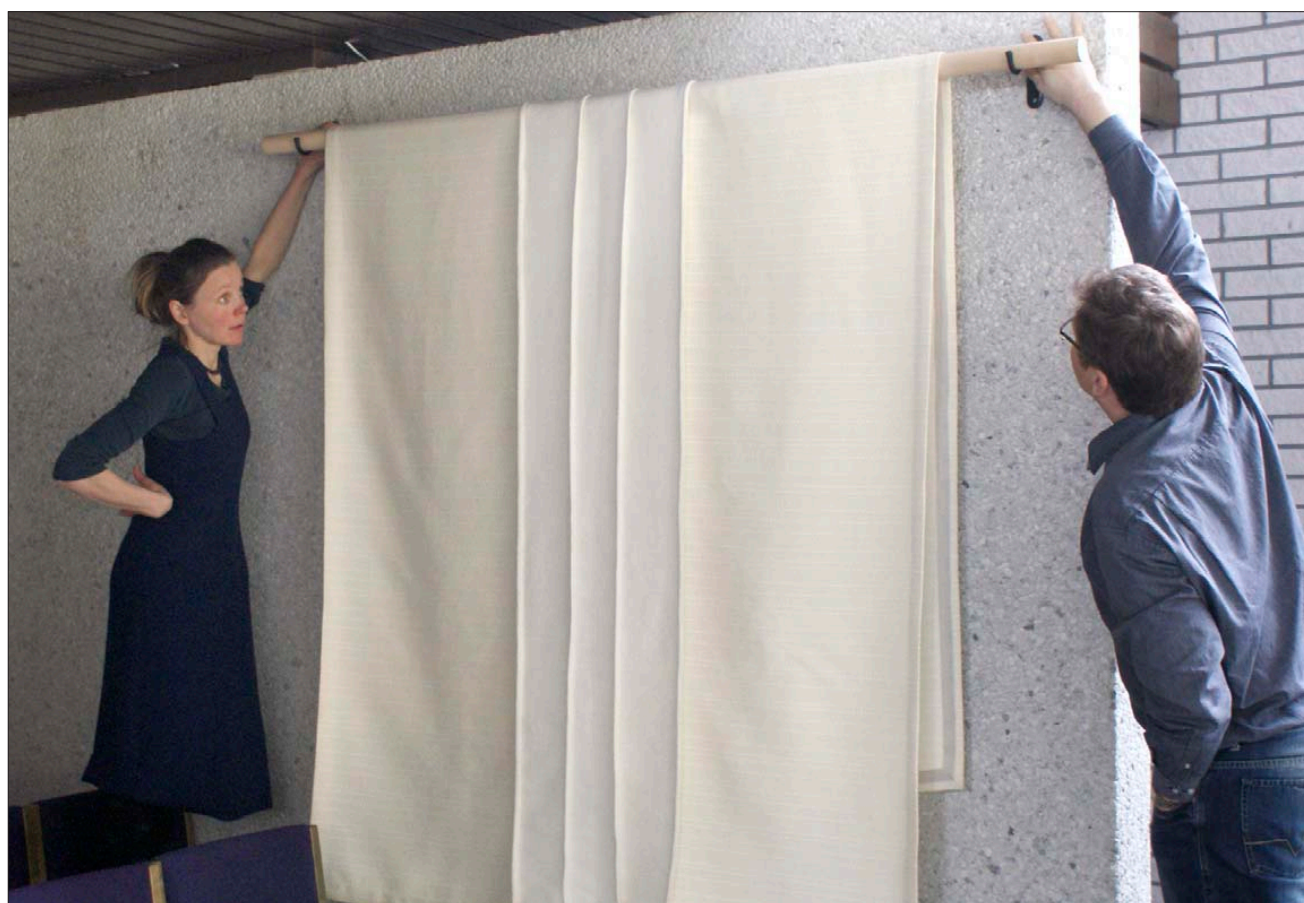
OUTILEENA Uutilan suunnittelema arkkuvalba valmistui huhtikuun lopussa.