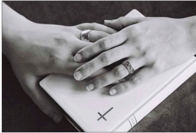
PARI voi alttarilla lausua toisilleen sormuslupauksen.

Toimitus kestää 10–20 minuuttia. Se ei siis ole kovin pitkä, vaikka parista kaiken järjestyksen keskellä saattaa siltä tuntua.