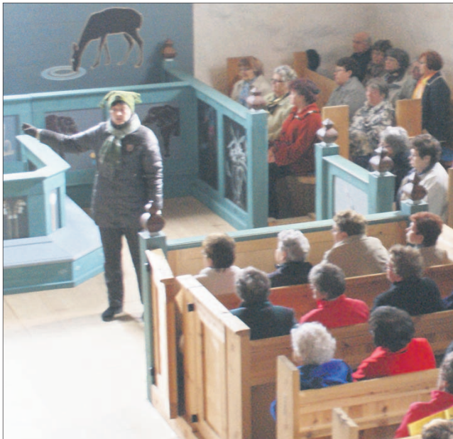
OPASTUSKIERROKSET ovat kysyttyjä ja antavat katselijoille ainutlaatuisen tietopaketin maalauksista ja paikan historiasta.

Kesäaikana kirkossa on ilta-bartaus joka sunnuntai-ilta kello 18. Jumalanpalveluksia pidetään joka kuukauden viimeisenä sunnuntaina klo 10.