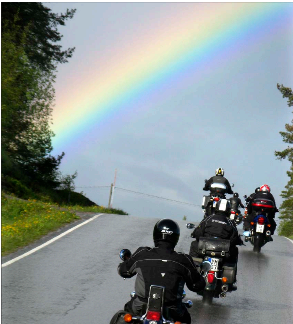
MOTORISTIKIRKKO kutsuu taas parin viikon päästä.

Poliisi ja MC Otamuksen väki on järjestänyt risteyksiin pyörät pysäyttämään muuta liikennettä, jotta letka pysyy yhtenäisenä eikä autoja tule väliin. Näin vältytään myös