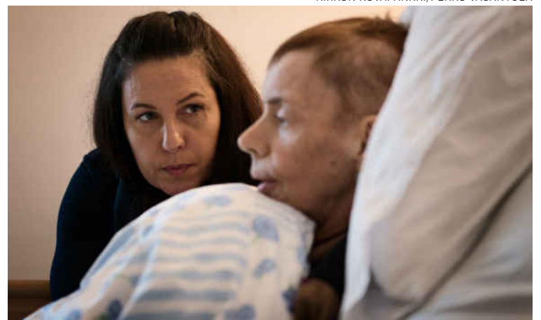
Toisen ihmisen läsnäolo on tärkeää kuolevalle.

Saattohoidon vapaaehtoisten koulutus koostuu noin seitsemästä tapaamisesta. Koulutuksessa saa ohjausta siihen miten kohdata saattohoidossa oleva ihminen ja olla läsnä toisen kanssa viimeisillä hetkillä. Koulutus ei vaadi erityisiä pohjatieto-