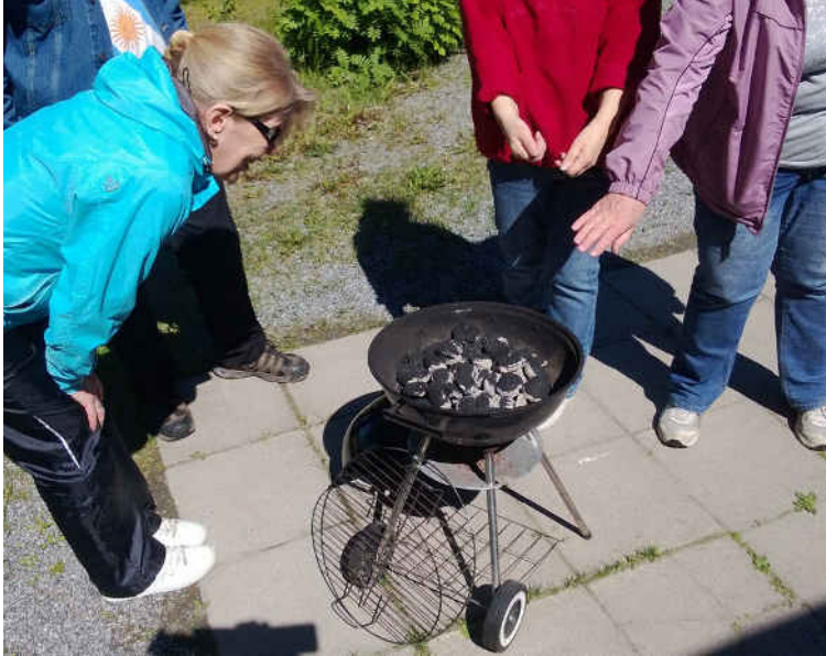
Marttilan väki puhalttaa yhteen hiileen – ihan konkreettisestikin.