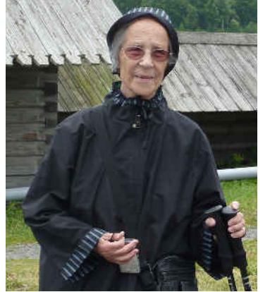
Ikä ei paina matkajaa. Sylviltä syntyvät myös matkakronikat.

Muistan ”ratinkääntäjät”, mutkaisen tieni taitavat turvallisuuden takaajat. Maailman parhaat ”juomalaskijat” (kahvi).