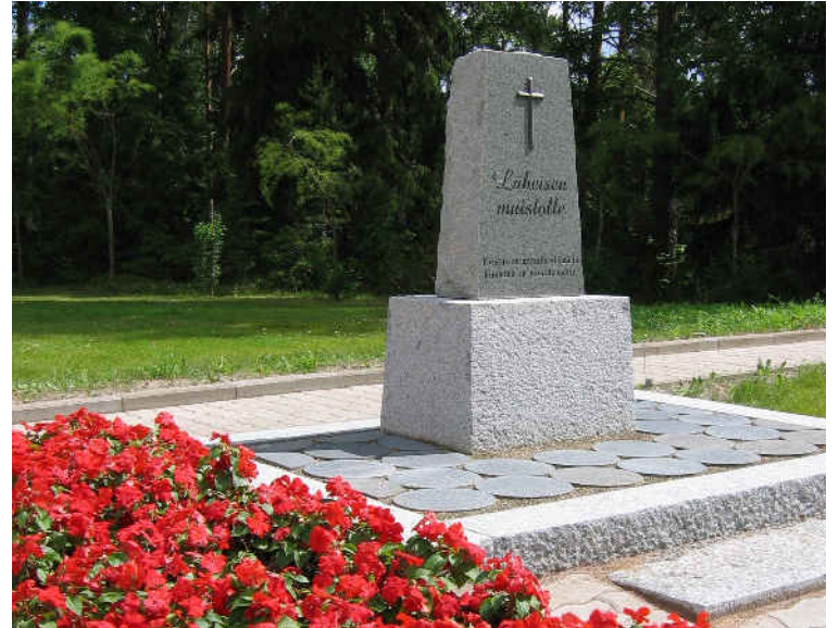
Suru tarvitsee aikaa ja paikkoja, missä kuollutta läheistä voi muistella.

Sururyhmässä voi luottamuksellisesti kertoa niistä tunteista, joita läheisen kuolema on herättänyt. Viha ja katkeruus ovat sallittuja tunteita, kuten myös nauru ja ilo. Mi-