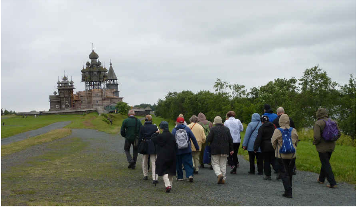
Matkalaiset tutustuivat restaurointityön alla olevaan Kizin pääkirkkoon.