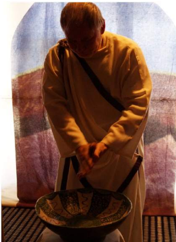
Pontius Pilatus on nähty sekä julmana virkamiehenä että hankalana välikäteen joutuneena sympaattisena hahmona. Kuva seurakunnan Via Dolorosa-pääsiäistapahtumasta.

Pontius Pilatus erottuu Jeesuksen surmaamisesta vastanneiden joukosta yllättäen kaikkein sympaattisimpana, ehkä hiukan sääliäntävänä-