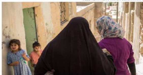
Ammanin kujalla. Kirkon Ulkomaanapu toimii Jordaniassa Za’atarin ja Azraqin leireillä sekä Ammanissa. Leirillä on alle 10 prosenttia Syyriasta paenneista, valtaosa sinnittelee muun väestön keskuudessa, pääasiassa Ammanin kujilla.

Ihmiset asuvat konteissa, ja avustajajärjestöt toimivat konteissa. Kaikki on tarkasti säädeltyä: leiriläi-