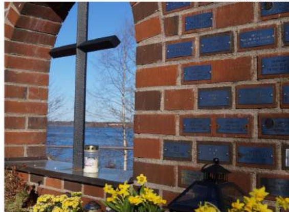
Meillä on tie ylös, kun aikamme koittaa - siinä on pääsiäisen suuri sanoma.