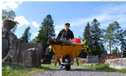
Satakunta nuorta työskentelee seurakunnassa eri tehtävissä vuosittain.

Nuorten työllistäminen on koko yhteiskunnan huolenaihe.