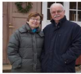
Telarannat nauttivat Pihlavan pirtin rauhasta ja haluavat tarjota sitä myös Majatalokahveiden vieraille.