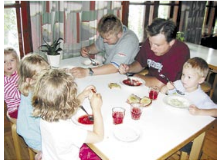
Leirillä syödään usein ja hyvin: nyt vuorossa on riisipuurohetki.

Erityisen vaikutuksen leirillä tekeisien osallistuminen ja omistautu-