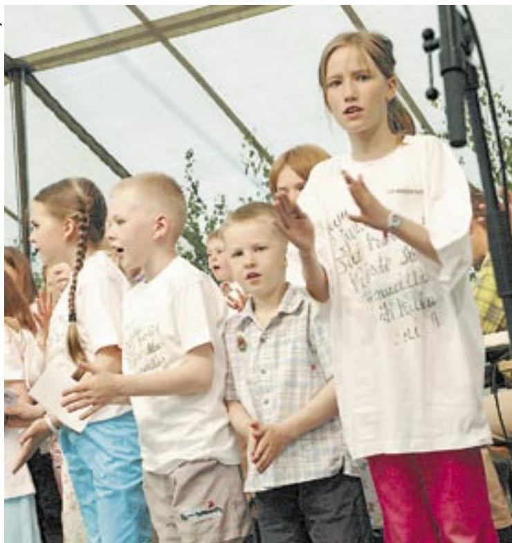
Lapset lauloivat sydämensä kyllyydestä myös lähetysjuhlien avajaisissa. Mukana oli sekä seurakunnan Leijat että vammalalaisia koululaisia.