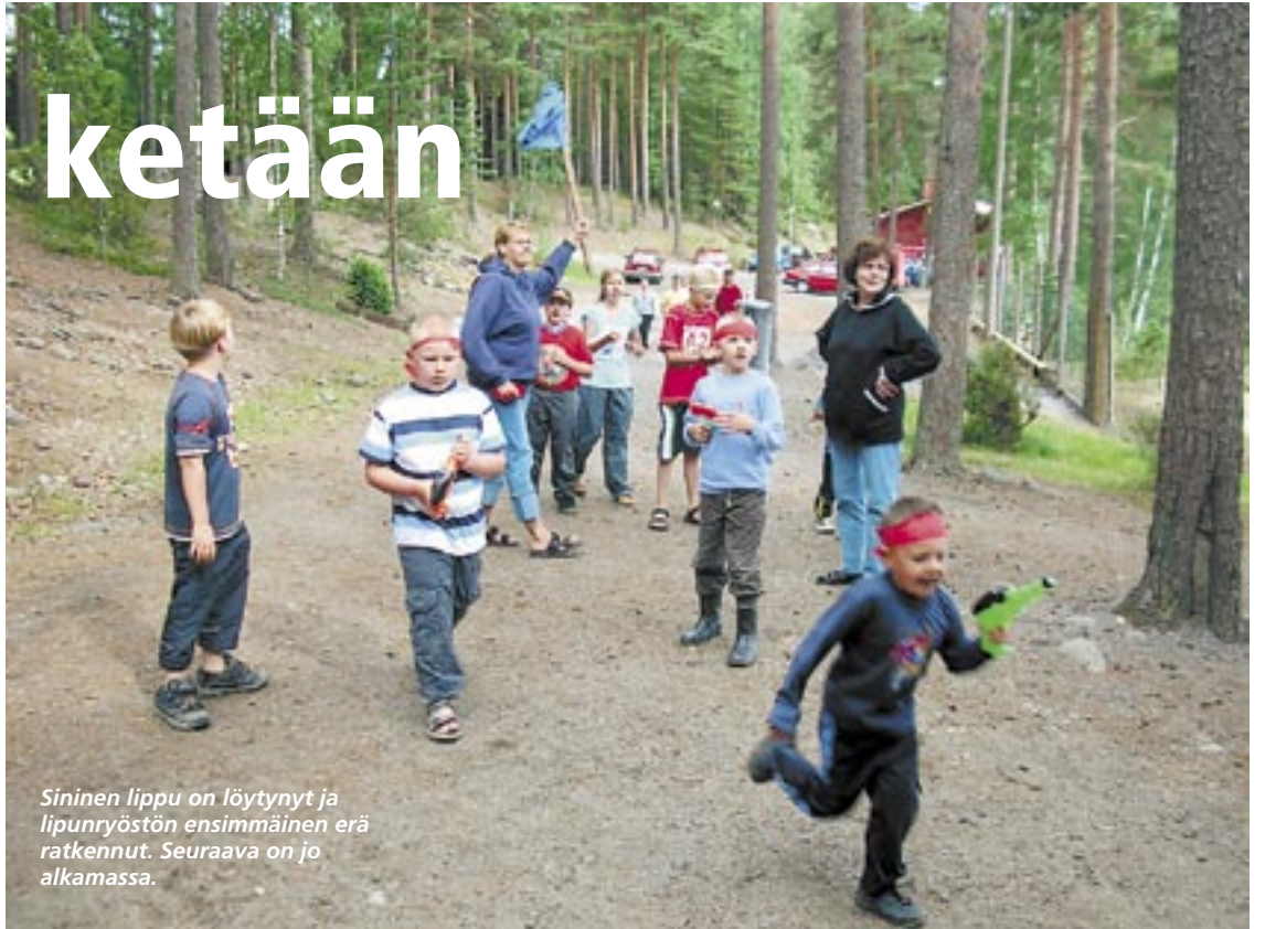
Sininen lippu on löytynyt ja lipunryöstön ensimmäinen erä ratkennut. Seuraava on jo alkamassa.

Kun paikalle saapuu vielä Istuva härkä eli Heikki, kolmikko al-