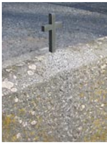
Kestävyydeltään kivi on lähes ikuisen. Ilman säännöllistä puhdistusta sammal, siitepöly ja puista tippuvat roskat voivat juuttua tiukasti muistomerkin pintaan.

Etenkin kultaukset vaativat helliä otteita, välineitä ja aineita. Nimet on kirjoitettu lehtikullalla pohjamaalin päälle, ja jos intomie-