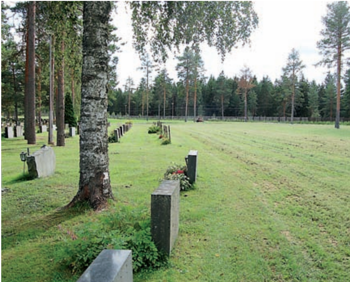
Vasemmalla näkyy kappelihautausmaan 70-luvun laajennusosaa, edessä ja oikealla uutta lisäaluetta. Takana olevaan kulmaukseen rajataan pensasaidalla tunnustukseton alue.

Tyrvään kappelihautausmaan 281 700 euroa maksanut laajennushanke on loppusuoralla. Työt alkoivat 2004, vain viimeistely ja muutamat istutukset ovat enää kesken.