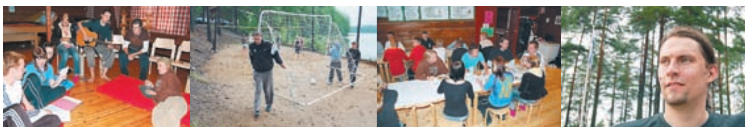
Iltaohjelman valmistelua ja palaverien pitoa isosten kanssa (vas.), jalkapalloa, lentopalloa ja muuta liikuntaa leiriläisten kanssa, yhteistä ateriointia – nuorisotyönohjaajan leiripäivään mahtuu monenlaista.